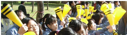
Klacken med hjällror...

Hejarklackfilm kan ses här: http://www.frick.nu/news/klacken.avi