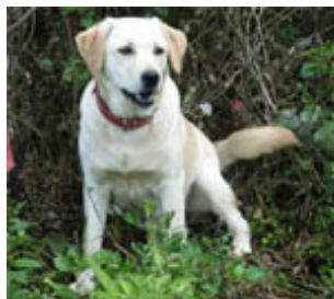
Ovanstående hund är dock snäll

Efter att ha blivit biten av en hund som finns på campusområdet fick jag insikt i det taiwanesiska sjukvårdssystemet. Och det gav ingen anledning till oro – tvärtom – också nästa gång jag behöver sjukvård så vet jag att en snabb och mycket effektiv sådan finns tillhands närhelst på dygnet.