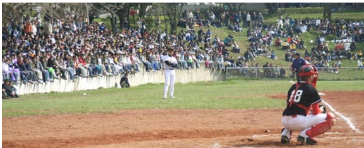
Baseball, Taiwans "nationalsport", ingår naturligtvis i plommonbambutävlingen

Varje år genomför de två grannuniversiteterna NCTU och NTHU tävlingar mellan studenterna. Tävlingarna kallas för 梅竹 (=plommon & bambu) omfattar allt från baseball och basket till schack – och nästa år kanske också innebandy.